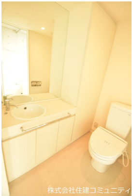
株式会社住建コミュニティ