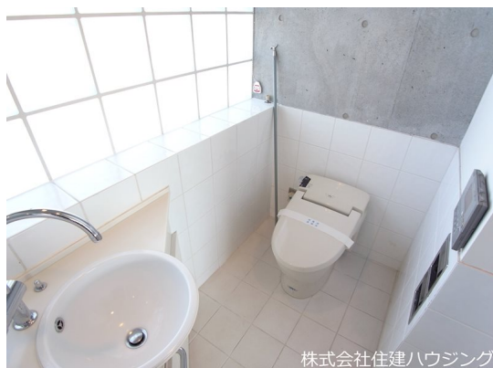
株式会社住建ハウジング